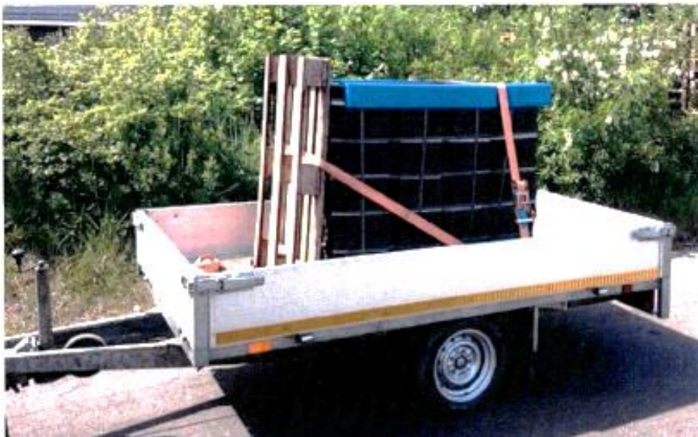
Abbildung 1 Beispiel Ladungssicherung – dargestellte Ware kann abweichen vom genannten Produkt